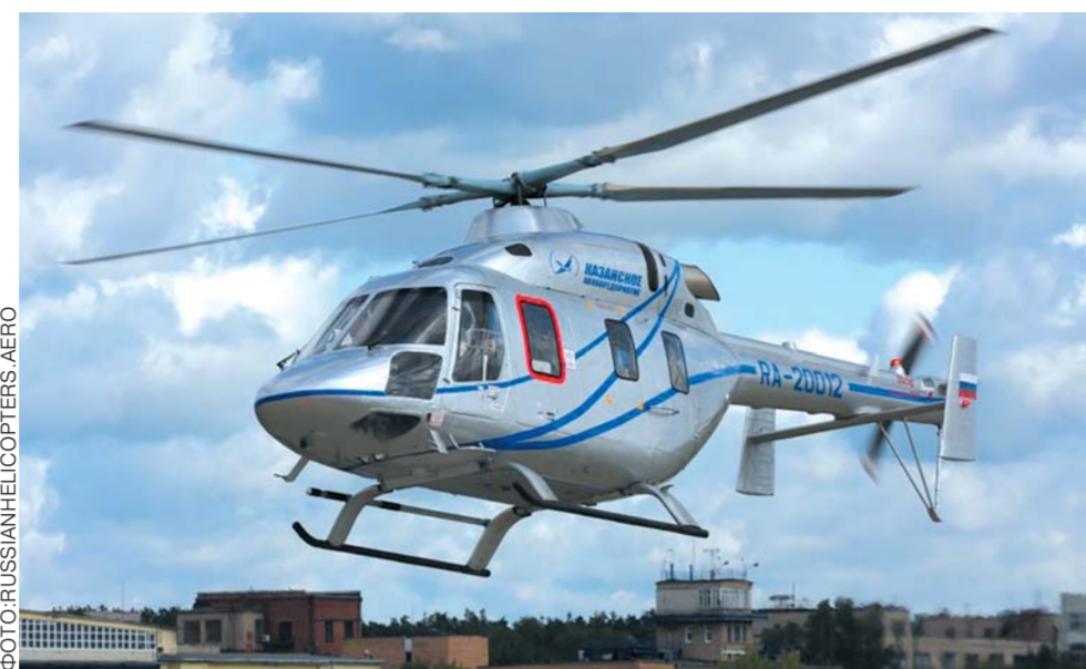
ФОТО: RUSSIAN HELICOPTERS Aero

Группа ТАИФ решила бросить все свои силы и средства на завершение в 2016 году начатого почти три года назад строительства комплекса глубокой переработки нефти стоимостью $1,6 млрд. Акционеры материнской компании группы – ОАО ТАИФ – в связи с этим решили отказаться от дивидендов с прибыли 2014 года, составившей около 10,8 млрд рублей (сни-