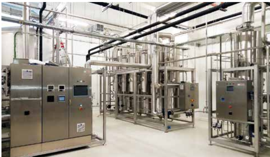
Высокотехнологичный научно-производственный комплекс «Гамма», г. Дубна. Монтаж слаботочных систем, 2018–2019 гг.