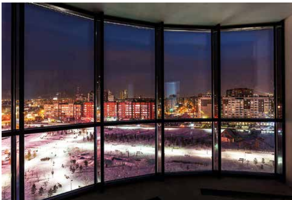
Панорамные витражные окна в гостиных

Компания «Арбан» является сторонником классических, проверенных временем технологий и одновременно открыта для инновационных решений. Конструктив дома Liner – яркий пример, подтверждающий это. Обычно из кирпича дома такой высоты не строят, однако «Арбан» благодаря стенам в 980 миллиметров удалось достичь необходимой прочности и устойчивости всей конструкции. Кирпич, использующийся при строительстве, тоже особенный – повышенной прочности. Его компания выпускает на собственном заводе в Канске. Толщина стен не только дала прочность, но и обеспечила необходимую теплоизоляцию. Мощность и надежность подчеркивается