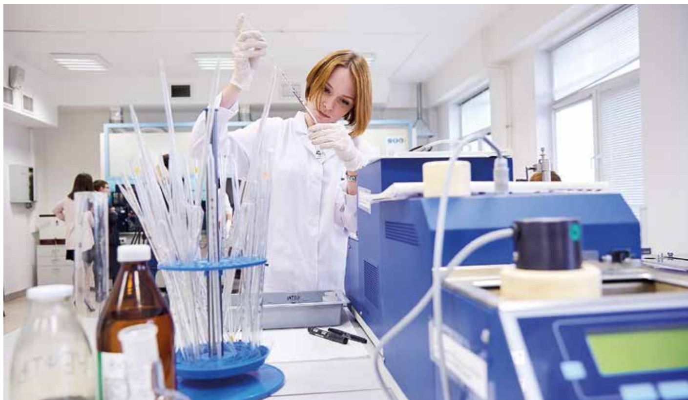
Эксперты уверены: рост конкурентоспособности экономики края смогут обеспечить только инновационные предприятия в связке с красноярскими вузами

Для Красноярского края, а также соседних Хакасии и Тувы такой точкой роста, как рассчитывают региональные власти, станет проект «Енисейская Сибирь». «Масштаб того, что предполагается сделать и какие средства инвестировать, делает этот комплексный инвестиционный план проектом федерального уровня, именно поэтому его поддержал российский президент. И сейчас готовится