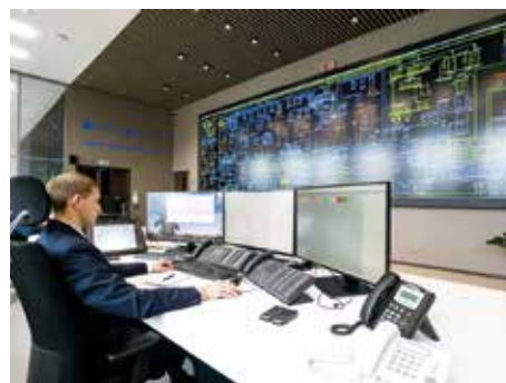
Центр управления сетями

Кроме того, с применением современных технологий в городе созданы Центр управления сетями Красноярского края, Центр управления энергообеспечением Уни-