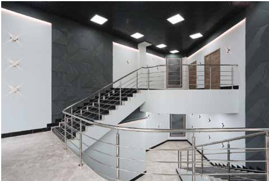
Внутренняя лестница к офисам и ресторанам