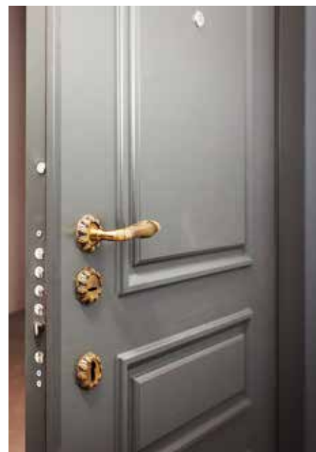
Входная дверь в квартиру