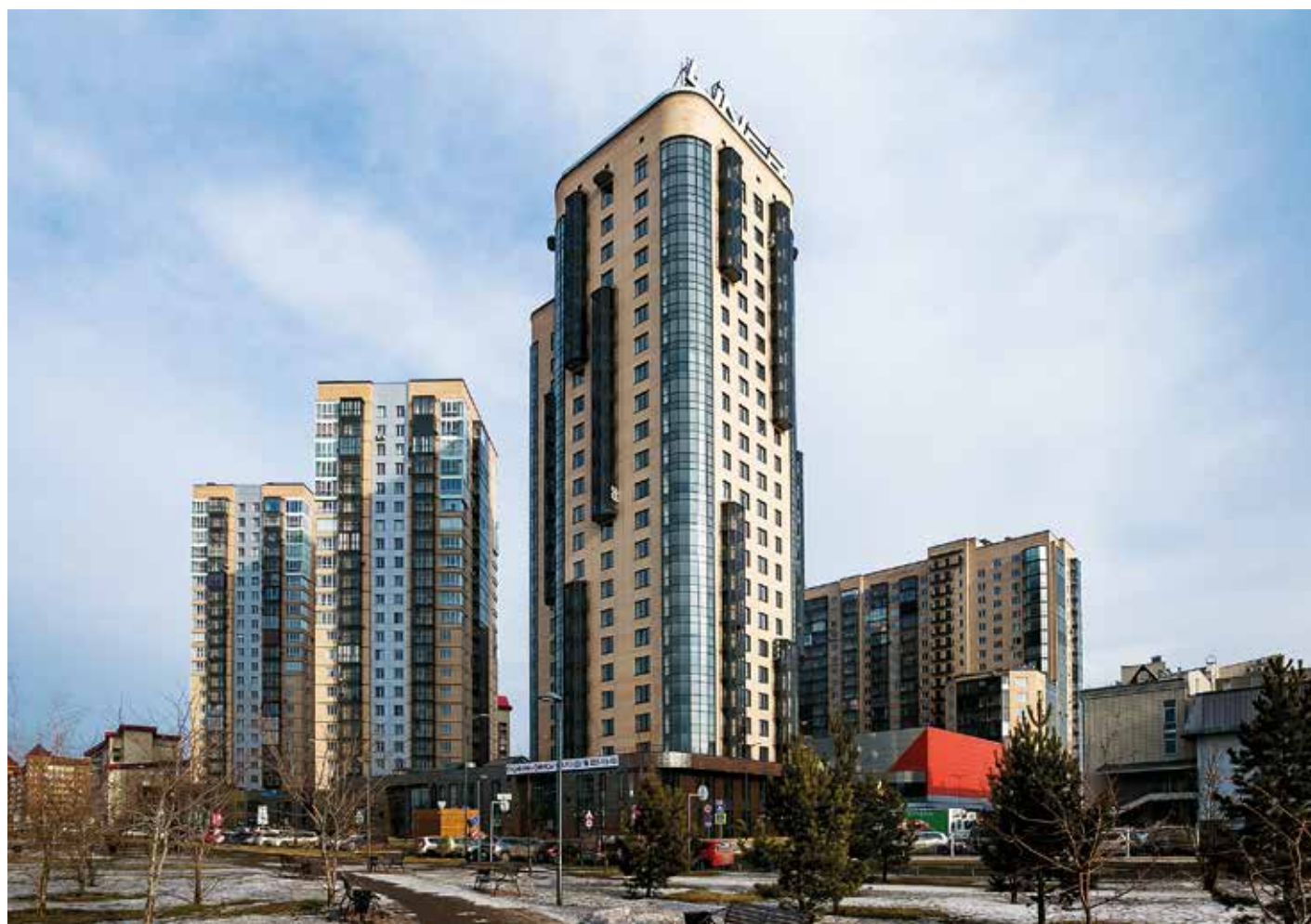
Liner – флагманский дом квартала Sky Seven

Большинство квартир – трехкомнатные, хотя есть двух- и четырехкомнатные. Высота потолков – три метра. При этом все планировки эксклюзивны – при разработке максимально учитывались пожелания и запросы самых взыскательных клиентов. В каждой квартире вне зависимости от площади есть место для размещения гардеробной комнаты, есть