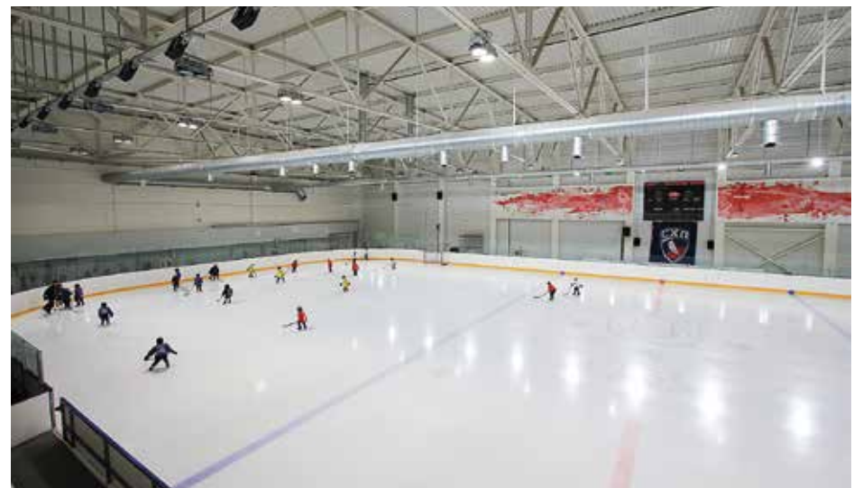
Ледовый дворец «Рассвет», г. Красноярск. Работы проводились в 2018 году