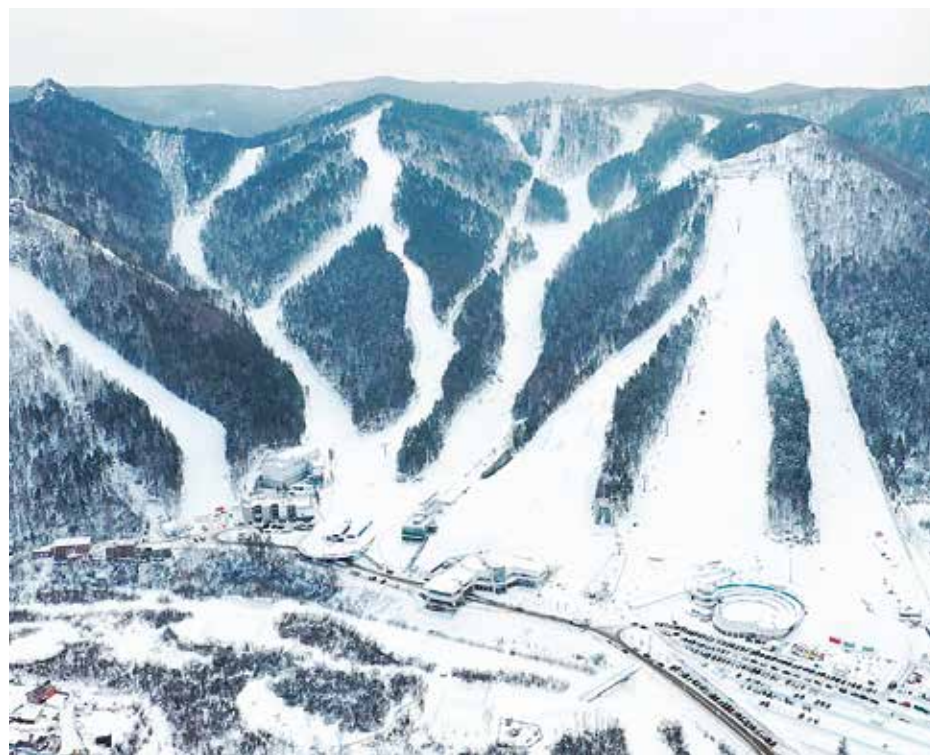
Наследие Зимней универсиады должно превратить Красноярск в один из важнейших спортивных центров страны и привлечь в регион постоянный туристический поток

Среди прочего в краевом центре должны появиться возможности для перемещения на альтернативных видах транспорта, прежде всего велосипедах. Для них на дорогах обещают сделать выделенные линии, места для парковки и точки аренды. Также власти обещают сформировать инфраструктуру для приема «социальных» туристов – инвалидов и пенсионеров.