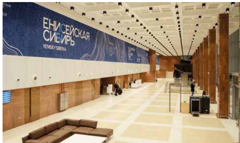
Новый облик исторического терминала международного аэропорта Красноярск

– Одно из важных и долгожданных событий – перевод международных линий в главный терминал. Первый