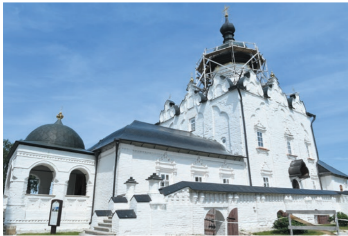
Успенский собор и монастырь Свяжска включили в список ЮНЕСКО