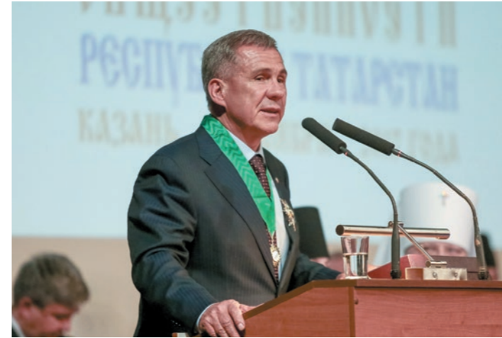
Рустам Минниханов получил орден Русской православной церкви