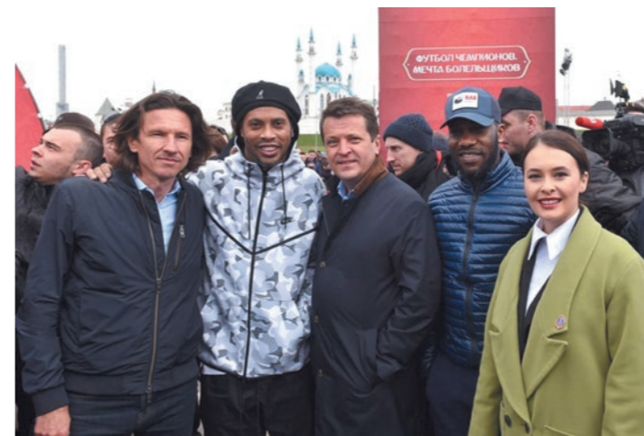
В Казани прошли матчи Кубка конфедераций