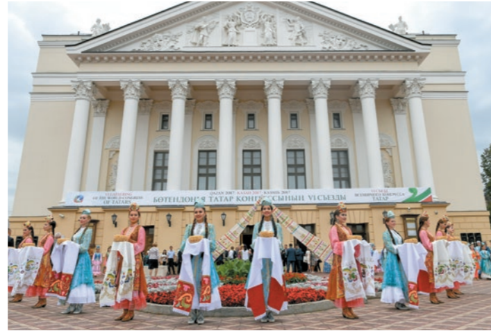
Татарский язык перестал быть обязательным в школе