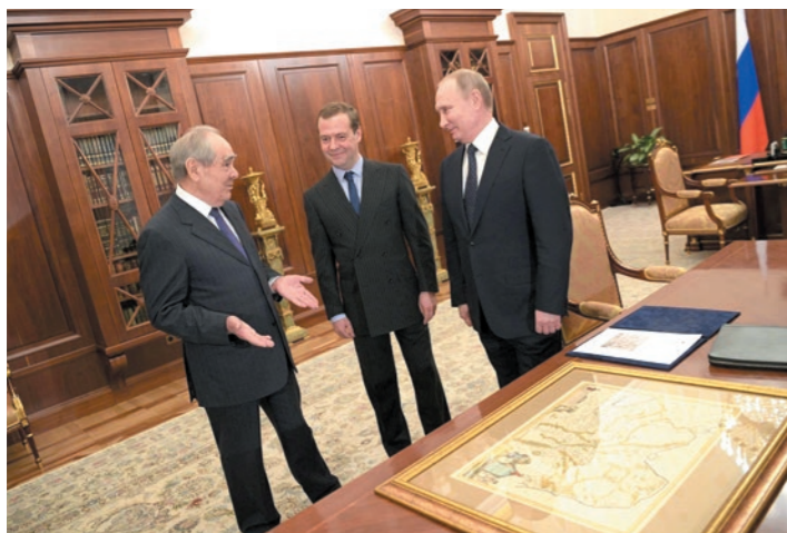
Федеральный центр не стал продлевать договор о разграничении полномочий