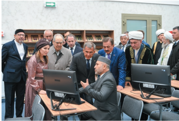
Открылась Болгарская исламская академия