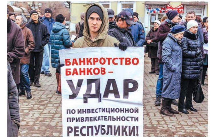
Прошли протестные акции вкладчиков Татфондбанка