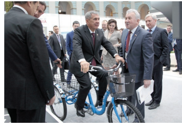
Чиновники Татарстана приняли участие в акции «День без автомобиля - 2017»