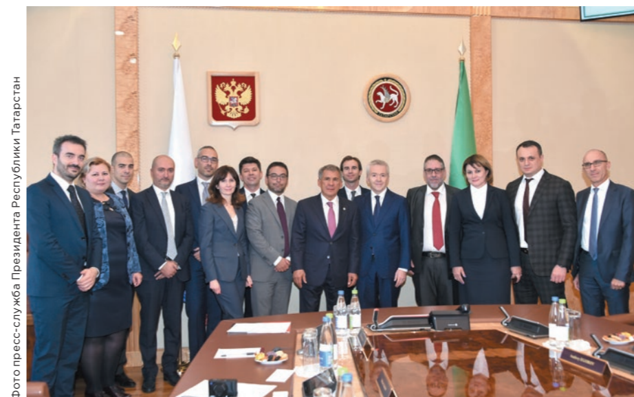
Встреча Президента Республики Татарстан и представителей Росбанка с делегацией Ассоциации итальянских промышленников в России

удалось привлечь более 400 новых компаний малого бизнеса. На сегодняшний день более 1,5 тыс. компаний региона выбирают Росбанк в качестве главного финансового партнера. По уровню удовлетворенности и лояльности Росбанк входит в ТОП-3 наиболее рекомендуемых банков для юридических лиц. Наше внимание в работе с предпринимателями сфокусировано на применении индивидуального подхода к каждому клиенту, на активном развитии транзакционных услуг и дистанционных каналов обслуживания.