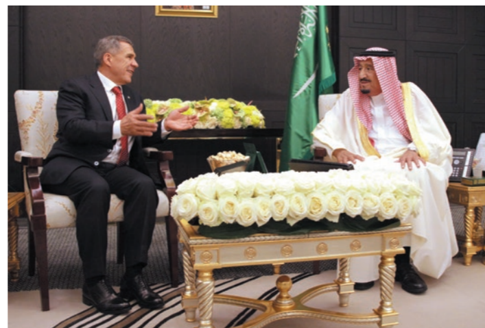
Президент Татарстана встретился с королем Саудовской Аравии