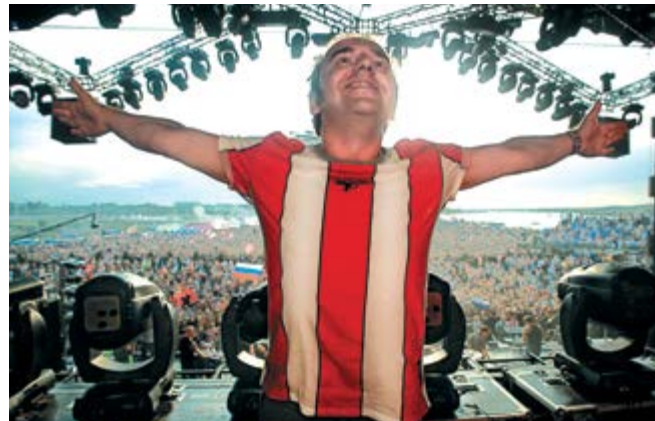
«Чайф», победитель номинации «Шоу-бизнес»