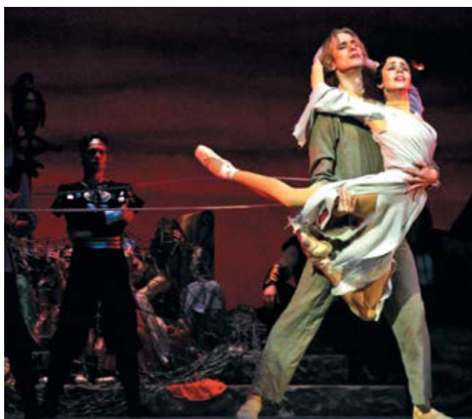
Екатеринбургский театр оперы и балета, III место, номинация «Культура»