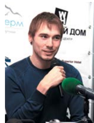
Антон Шипулин, победитель номинации «Спорт»