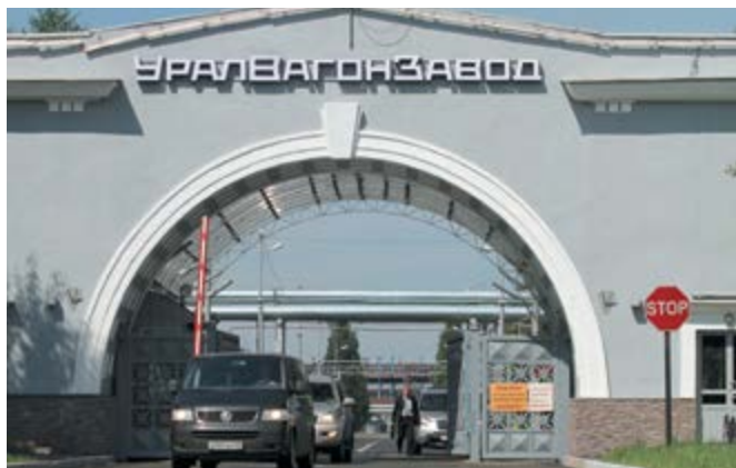
«Уралвагонзавод», победитель номинации «Бизнес»