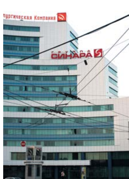
Трубная металлургическая компания, V место, номинация «Бизнес»