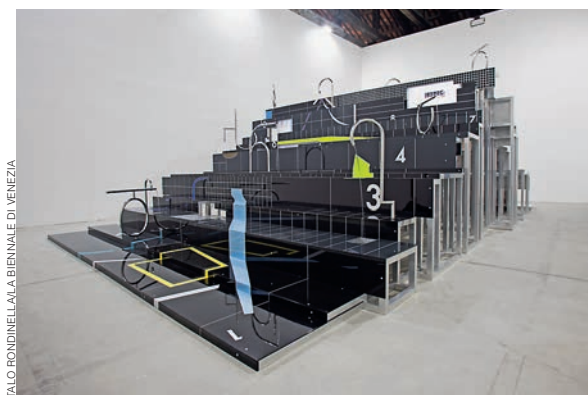
— Павильон Грузии