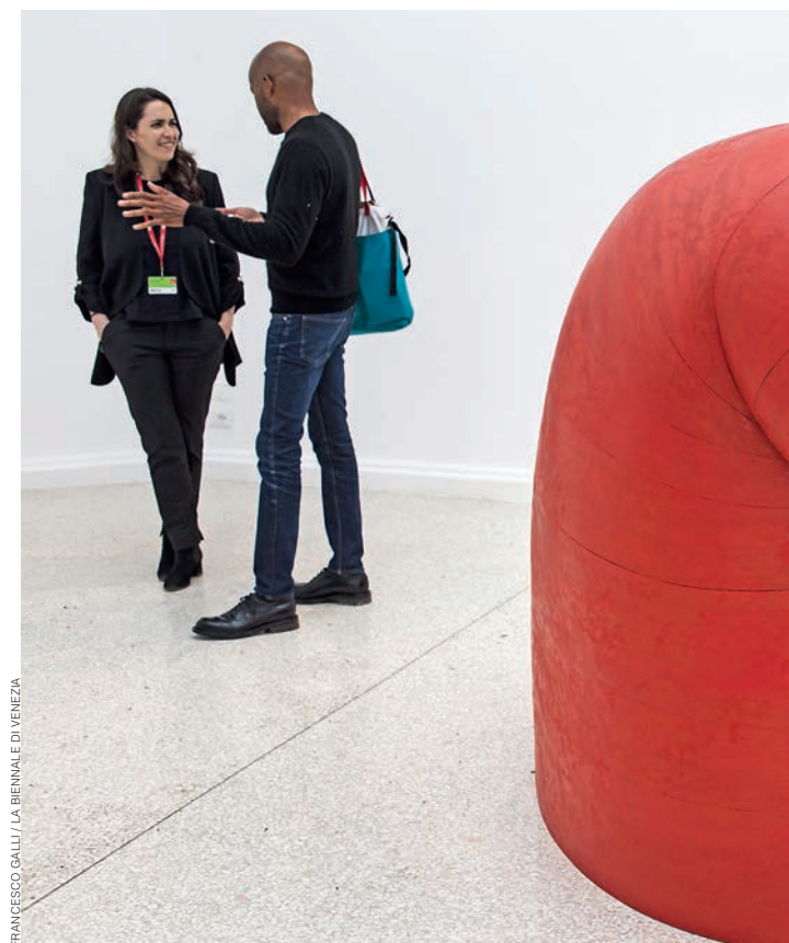
— Павильон США