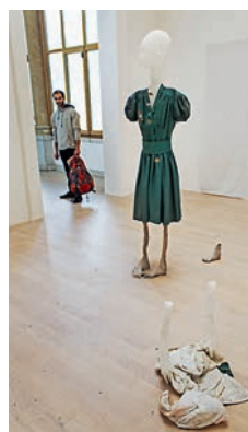
— Павильон Великобритании