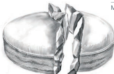
— Эскизы Фернандо Мастранджело