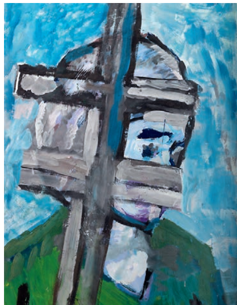
— Владимир Яковлев, «Портрет с крестом», 1970-е