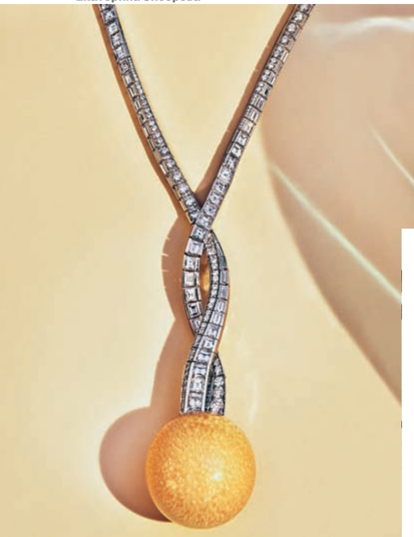
Колье Blue Book Autumn, платина, жемчужина Мело, бриллианты

Процесс производства колье Blue Book Winter, платина, бриллианты