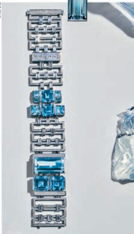
Браслет Blue Book Winter, платина, аквамарины, бриллианты