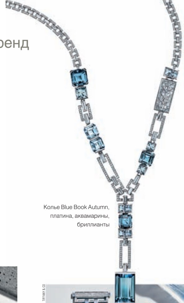
Колье Blue Book Autumn, платина, аквамарины, бриллианты