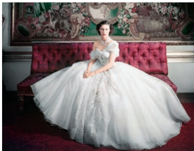
Принцесса Маргарет в платье Christian Dior, фотограф Сесил Битон