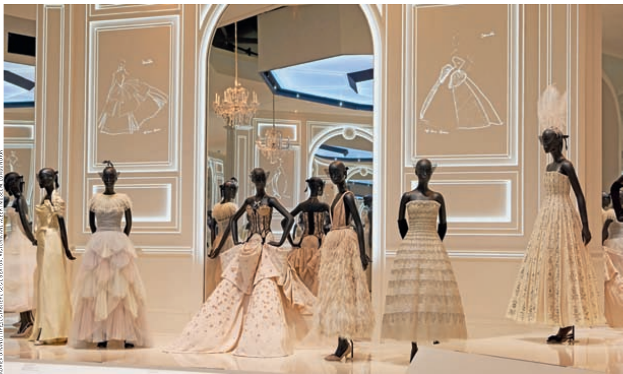
ADRIEN DIRAND / L'ESPRESSO / STEPHEN DE OL BEATON, VICTORIA AND ALBERT MUSEUM, LONDON, DIOR