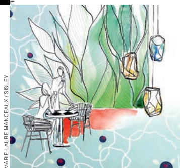
MARIE-LAURE MANGEAUX / SISLEY