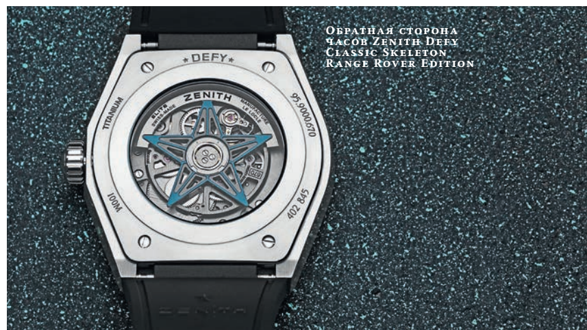
ОБРАТНАЯ СТОРОНА ЧАСОВ ZENITH DEFY CLASSIC SKELETON RANGE ROVER EDITION