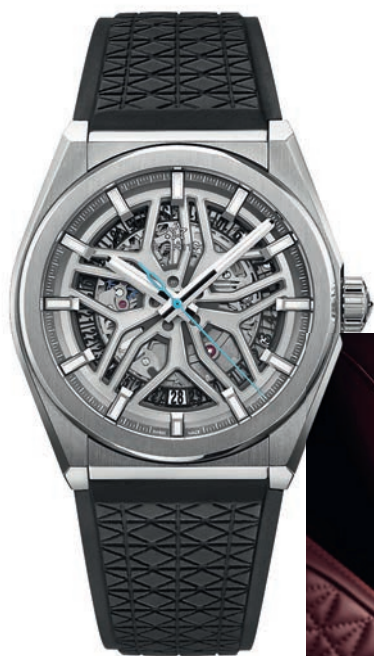
DEFY CLASSIC SKELETON RANGE ROVER EDITION, ТИТАН, 41 ММ, МЕХАНИЗМ С АВТОМАТИЧЕСКИМ ПОДЗАВОДОМ, ЗАПАС ХОДА 50 ЧАСОВ