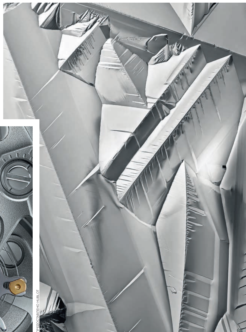
ДЕТАЛИ МЕХАНИЗМА UNICO