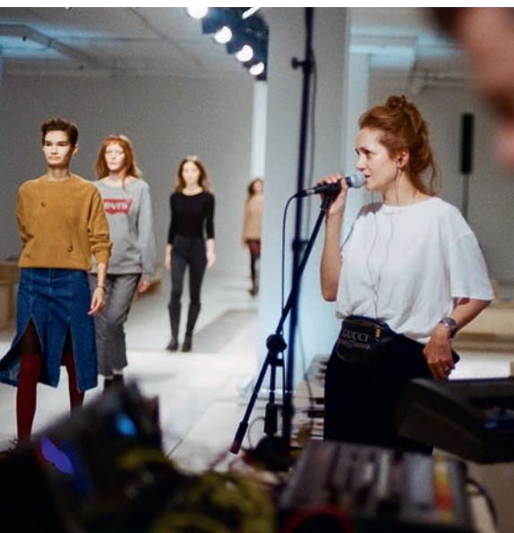
АКТРИСА ВИКТОРИЯ ИСАКОВА РЕПЕТИРУЕТ СВОЕ ВЫСТУПЛЕНИЕ НА ШОУ