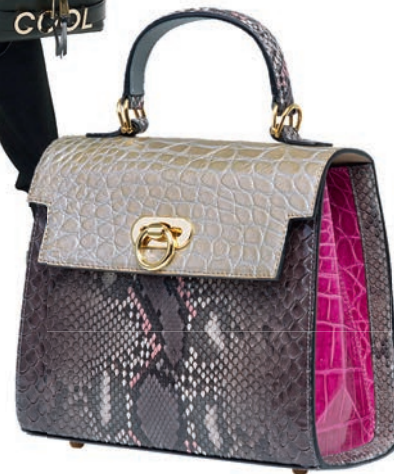
Все модели коллекции Осень-Зима 2018/19 Дома RASCHINI выполнены из натуральных материалов выделки высокого класса: шерсти, кожи, шелка, кашемира, меха лисы, бобра, мутона, норки и оленя