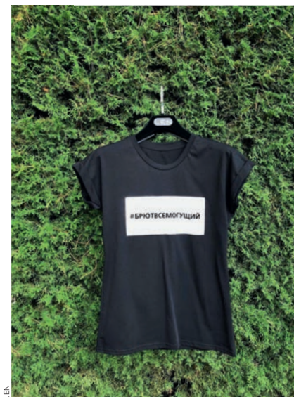
К Новому году российский бренд LEN выпустил лимитированную серию футболок с хештегом #БРЮТВСЕМОГУЩИЙ. Намекая на то, что все будут в новогоднюю ночь выкладывать фотографии с вечеринки