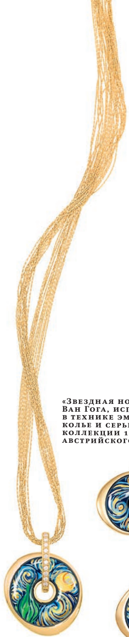
«Звездная ночь» Винсента Ван Гога, исполненная в технике эмали, украшает кольцо и серьги из новогодней коллекции 18K Gold&Diamonds австрийского бренда FREYWILLE