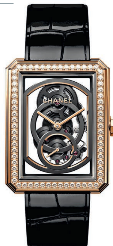
— Часы Boy.friend Skeleton, 37 x 28,6 x 8,4 мм, бежевое золото, бриллианты, скелетонированный мануфактурный механизм Calibre 3 с ручным подзаводом, 55-часовой запас хода; водонепроницаемость 30 м