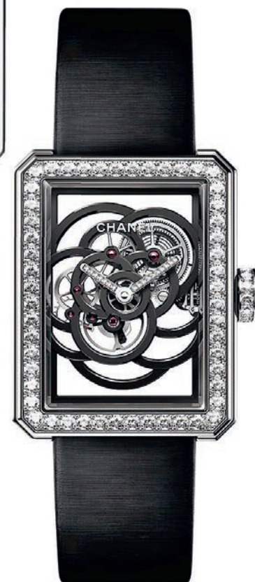
— Часы Premiere Camelia Skeleton, 37 x 28,5 x 10,2 мм, белое золото, бриллианты, скелетонированный мануфактурный механизм Calibre 2 с ручным подзаводом; водонепроницаемость 30 м