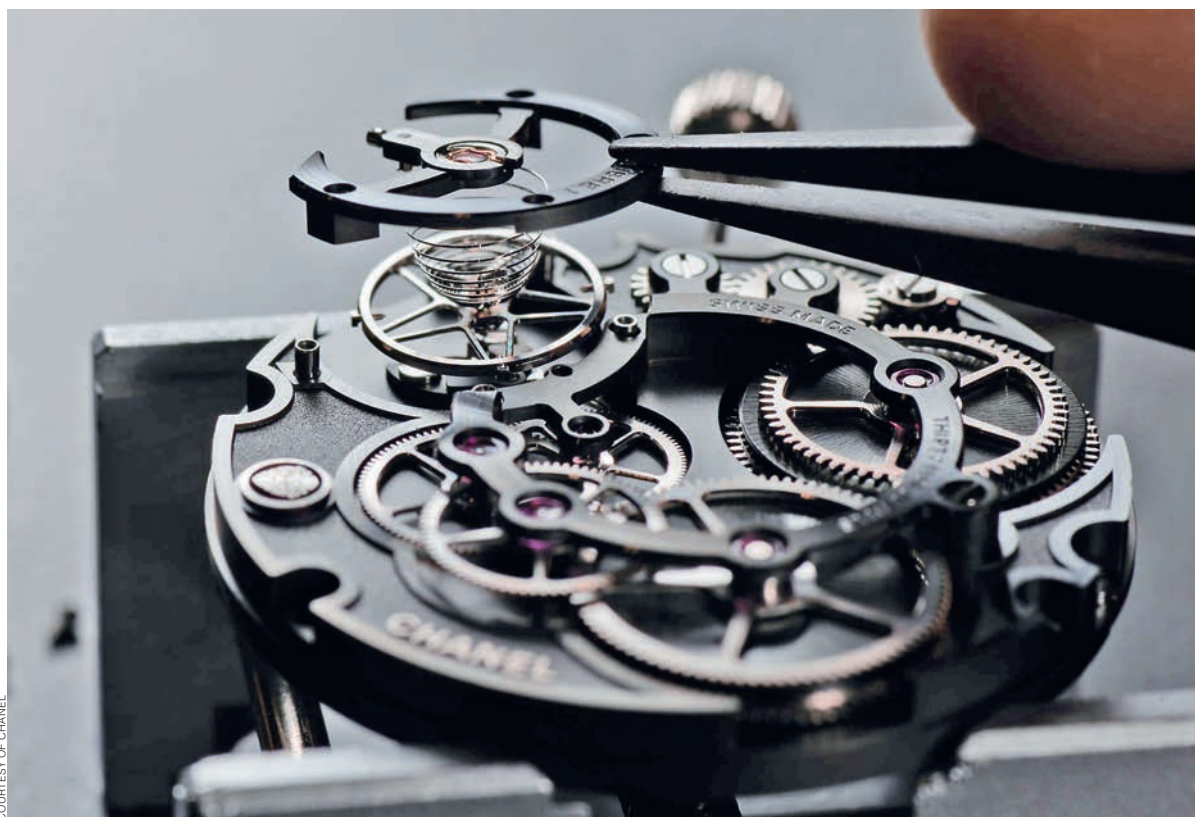
— Процесс сборки мануфактурного механизма Chanel Calibre 1

Мануфактура Chatelain благодаря этому сотрудничеству из здания площадью 1800 кв. м в 2012 году переехала в новое, площадью в 8000 кв. м, и получила возможности для дальнейшего расширения поля деятельности: когда все департаменты мануфактуры рядом, время на производство значительно сокращается, а продуктивность увеличивается. Основанная в 1947 году изначально как мастерская по полировке часовых компонентов, в следующие полвека Chatelain стала фабрикой по их изготовлению, сборке и финишной обработке, и сейчас здесь работает более 350 человек. А накопленные знания о традиционных способах изготовления часов были усилены самым современным машинным оборудованием. Сегодня мануфактура производит корпуса, звенья для металлических браслетов, некоторые компоненты часовых механизмов, плюс тут сосредоточено все керамическое производство для часов и украшений Chanel. С 2011 года появилось специальное подразделение, задачей которого стало изготовление мануфактурных калибров для парижского бренда. Потребовалось пять лет разработок, прежде чем появился первый результат.