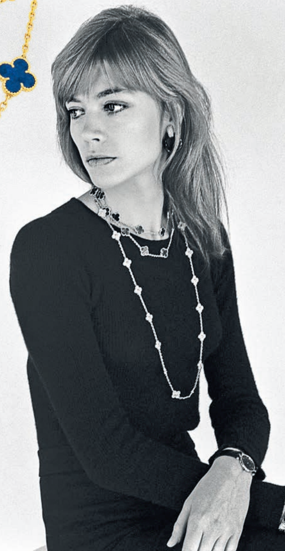
Франсуаза Арди в украшениях Van Cleef & Arpels, 1974 год