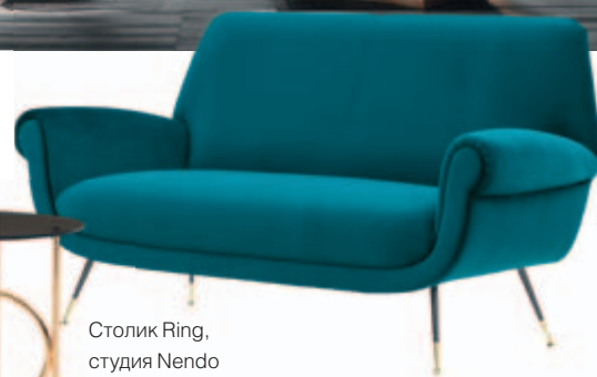
Диван Albert & Ile

Промофильмы были иронично стилизованы под трейлеры к голливудским блокбастерам: с драматичной музыкой, неожиданными ракурсами и нераскрытой интригой. Мол, ожидайте на лучшем мебельном салоне мира... И ожидание того стоило. Авторами юбилейной коллекции были выбраны удивительно разные дизайнеры-протагонисты — японец Оки Сато (студия Nendo), бразильский архитектор Марсио Коган, француз Кристоф Делькур и, конечно, Родольфо Дордони, вещи которого снова составили кос-