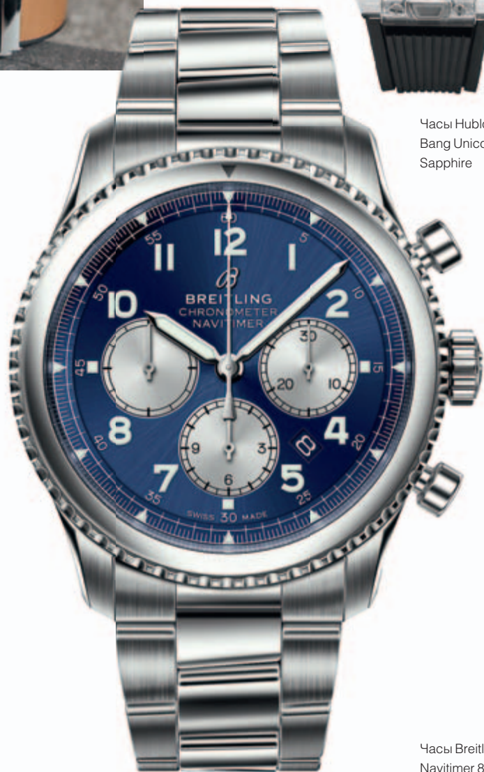
Часы Breitling Navitimer 8 B01