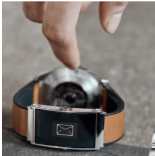
Часы Montblanc с «умным» ремешком Twin Smart