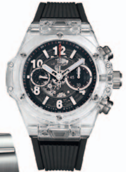
Часы Hublot Big Bang Unico Magic Sapphire

ВАЖНЫМ ЭТАПОМ В РАЗВИТИИ ЧАСОВОГО ДЕЛА СТАЛО ВЫДЕЛЕНИЕ ПРОФЕССИИ ДИЗАЙНЕРА В САМОСТОЯТЕЛЬНУЮ КАТЕГОРИЮ, НЕ РЕДКО ОПРЕДЕЛЯЮЩУЮ УСПЕХ ТОЙ ИЛИ ИНОЙ МОДЕЛИ