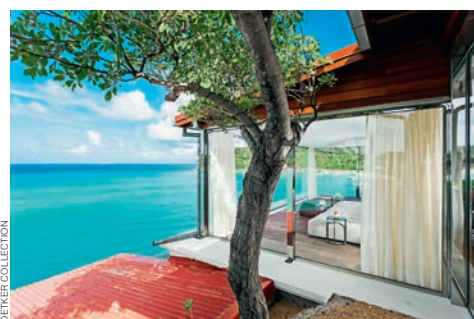
EDEN ROCK НА ОСТРОВЕ СЕНТ-БАРТЕЛЕМИ (СЕН-БАРТ)

Все меньше семей приезжают в определенную гостиницу надолго, как было заведено раньше. Новое поколение жаждет увидеть весь мир! И все же каждые два-три года они готовы возвращаться в излюбленные уголки, главное — уметь поддержать этот интерес.