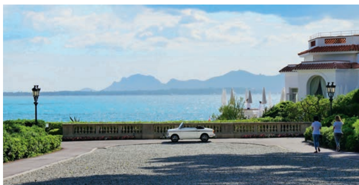
HOTEL DU CAP-EDEN-ROC В АНТИБАХ

Каждый раз, планируя открытие или реновацию отеля, мы стремимся опередить время на несколько лет. Проектная команда Oetker Collection в экспериментальном гостевом номере Room Laboratory в парижском Le Bristol тестирует новейшее оборудование, например телевизоры толщиной в лист бумаги нашего глобального партнера Samsung, «умную» мебель. И если технологии позволяют сделать так, чтобы душ запомнил комфортную для гостя температуру воды, а рядом было устройство, которое позволит ему привычно поболтать с Алексой, то предоставить все это — наша обязанность. Сейчас мы устанавливаем в Room Lab стекло, которое поглощает солнечную энергию, — в одном из новых отелей такое остекление позволит полностью обеспечить подогрев воды. Во многих наших гостиницах используются кровати, которые поднимаются, чтобы горничным было удобнее их перестилать. В Mercedes S-класса автопарка Brenners Park-Hotel & SPA в Баден-Бадене в подлокотники на заднем сиденье встроены беспроводные зарядники. Забота о гостях, сотрудниках, окружающей среде — это то, что мы включаем в понятие «роскошь».