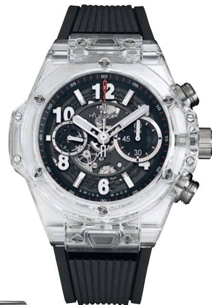
ЧАСЫ HUBLOT BIG BANG UNICO MAGIC SAPPHIRE