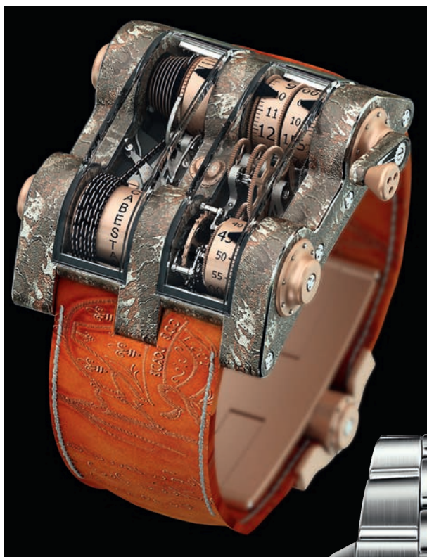
ЧАСЫ SABESTAN ROMAIN JEROME TITANIC-DNA

Оригинальные новинки стремятся представить не только авангардные бренды, но и классические марки. Например, Cartier несколько лет назад выпустил коллекции Diver, Drive. Vacheron Constantin сделал абсолютно новую линейку FiftySix, а Breitling — Navitimer 8. Конечно, их не сравнить с трубками с жидкостью от HYT, но для самих классических марок это, безусловно, смелые решения.