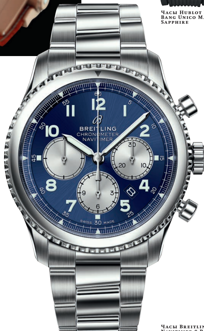
ЧАСЫ BREITLING NAVITIMER 8 Bo1