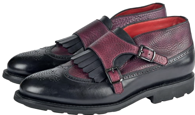
ОБУВЬ ИЗ НОВОЙ КОЛЛЕКЦИИ BARRETT