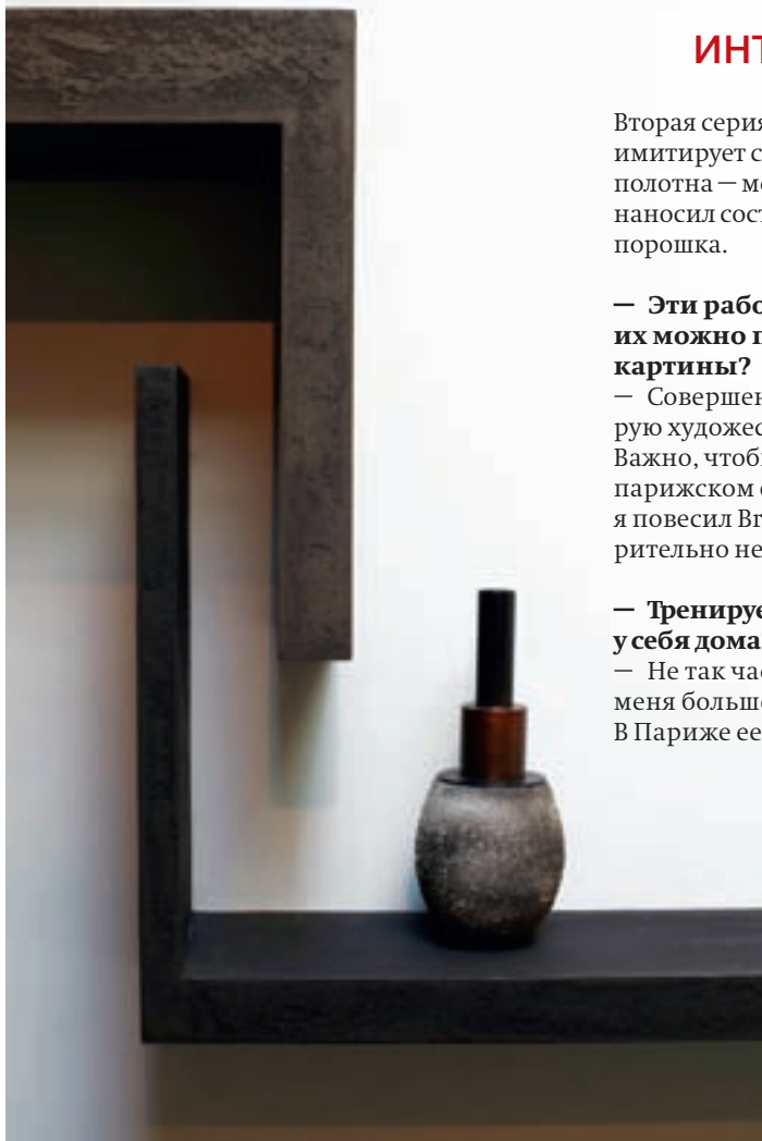
Детали декора по дизайну Пьера Бонфия