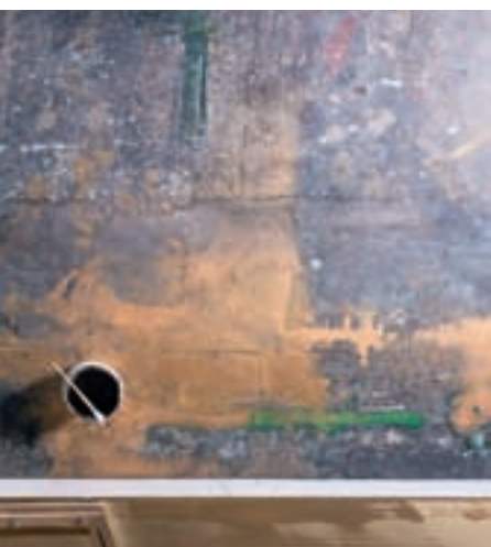
Художник за работой в своей студии