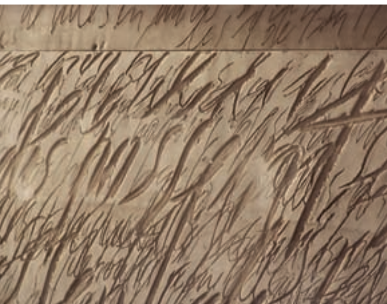
Фирменный почерк художника — сложные фактуры с необычным декором