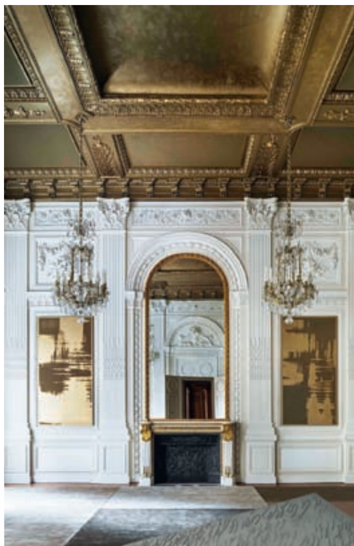
Работы серии Bronze Paintings в интерьере

ЭТО ЧИСТЫЙ ЭКСПРОМТ, И ОН СОЗДАЕТСЯ КАЖДЫЙ РАЗ В ЕДИНСТВЕННОМ ЭКЗЕМПЛЯРЕ