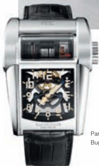
Parmigiani Fleurier Bugatti Type 390