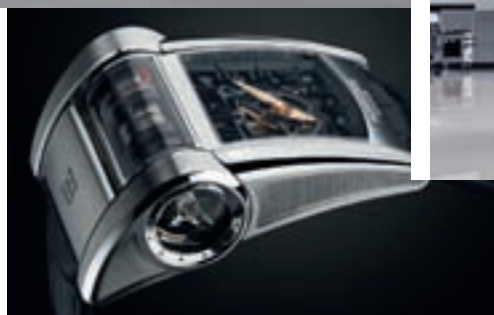
Обводы корпуса часов похожи на аэродинамические формы Bugatti Chiron