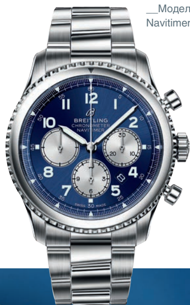
__Модель Navitimer 8 B01