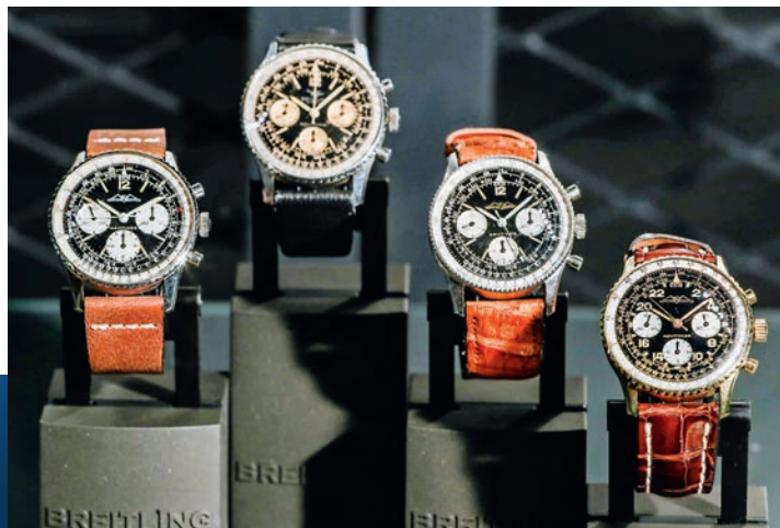
__Выставка историче- ских моделей Breitling