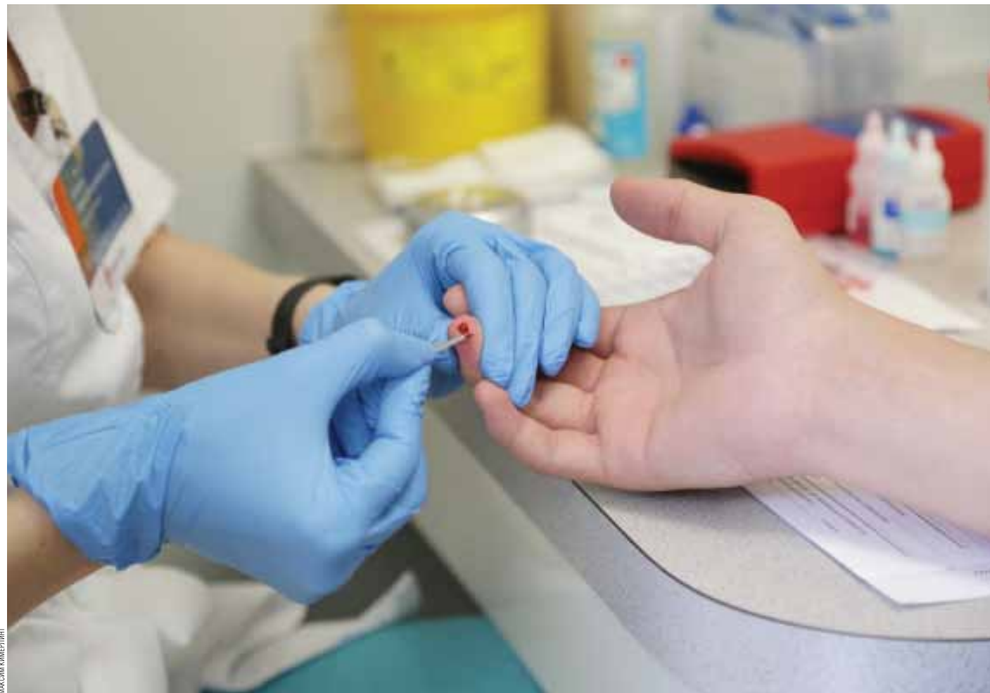
ПРОВЕДЕНИЕ ПЕРИОДИЧЕСКИХ МЕДИЦИНСКИХ ОСМОТРОВ РАБОТНИКОВ РЕГЛАМЕНТИРОВАНО ЗАКОНОДАТЕЛЬСТВОМ

«Многие пермские производственные предприятия, заинтересованные в сохранении рабочей силы, реализуют на своих предприятиях различные медицинские, страховые программы. На некоторых крупных предприятиях сохраняются условия в рамках коллективного договора (в частности, где есть вредные условия труда): санаторий-