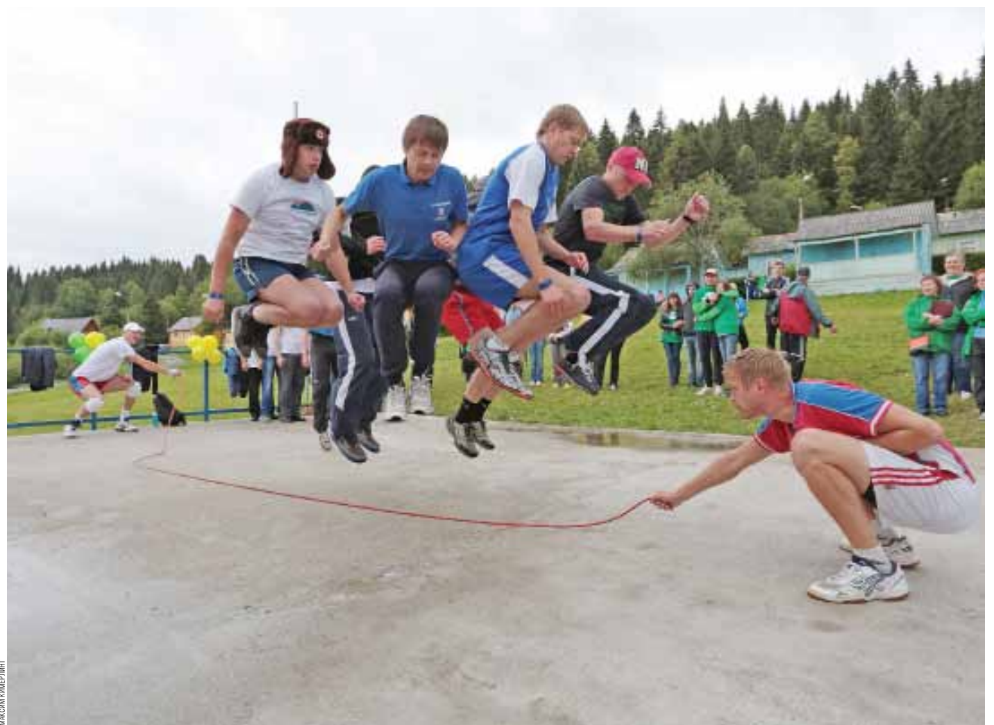
МНОГИЕ КРУПНЫЕ ПРЕДПРИЯТИЯ УСТРАИВАЮТ КОРПОРАТИВНЫЕ СПАРТАКИАДЫ ДЛЯ ПОПУЛЯРИЗАЦИИ ЗДОРОВОГО И АКТИВНОГО ОБРАЗА ЖИЗНИ