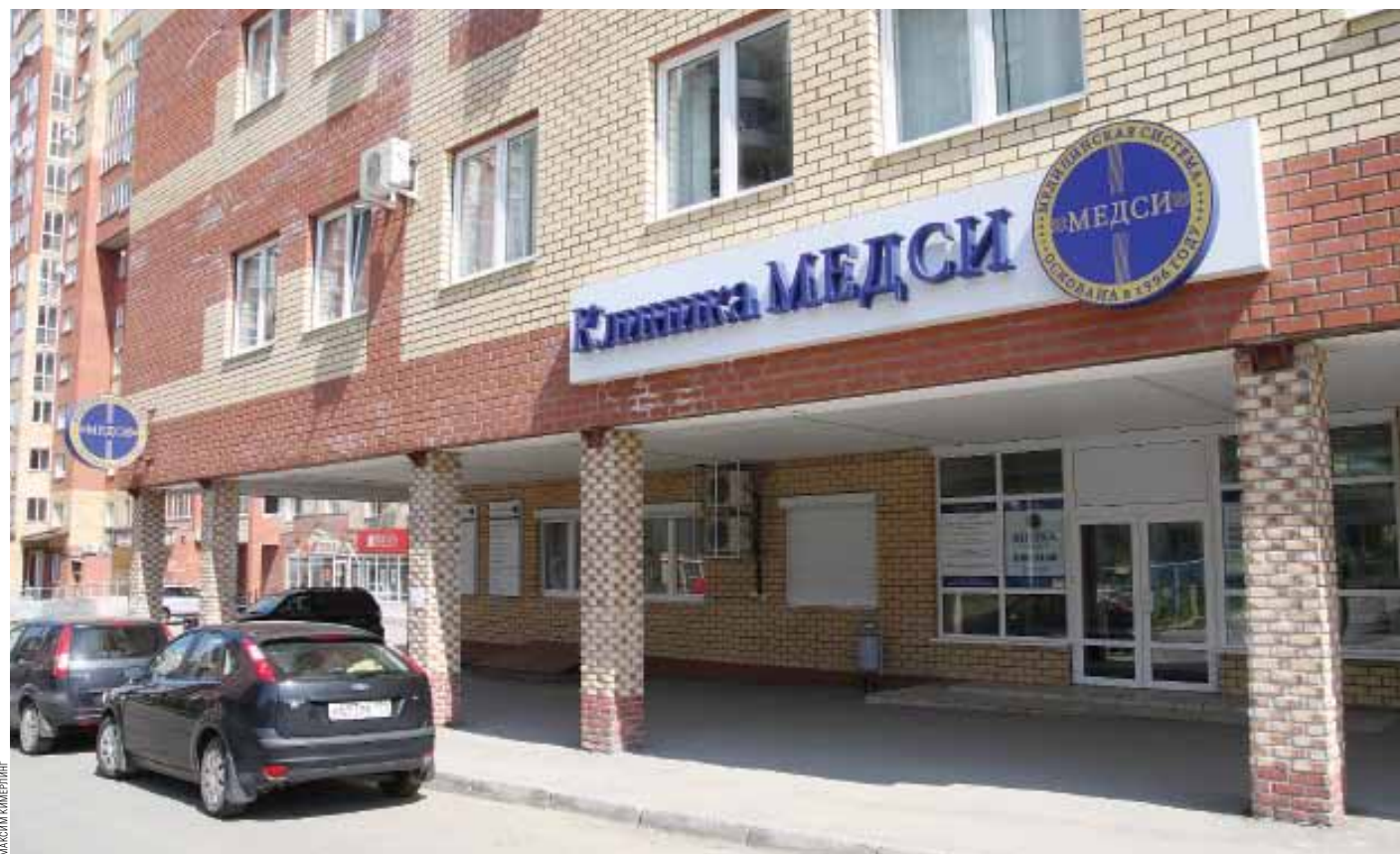
МНОГИЕ КРУПНЫЕ ИГРОКИ НЕ ВИДЯТ НЕОБХОДИМОСТИ ЗАХОДИТЬ В СИСТЕМУ ОМС