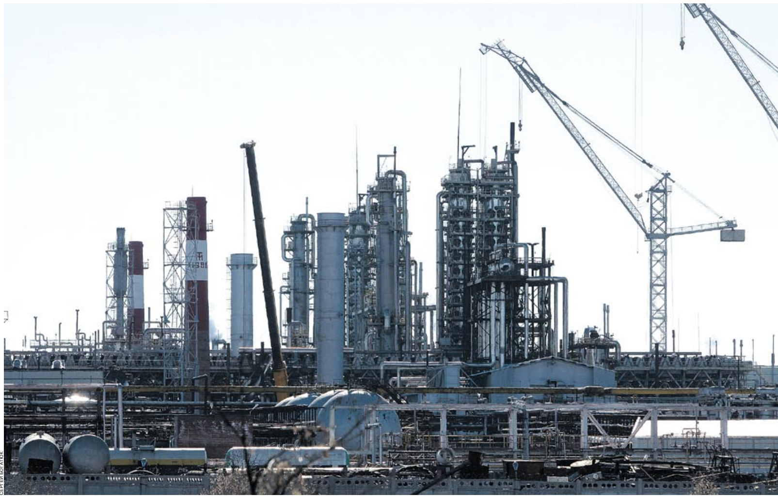
В 2017 году в регионе снизилось производство аммиака из-за временного прекращения транзита через Украину

Финансовые результаты за 2017 год компания пока не раскрывает. По итогам девяти месяцев прошлого года чистая прибыль общества по РСБУ составила 1,612 млрд руб., что сопоставимо с результатами за аналогичный период 2016 года (1,663 млрд руб.). Выручка в третьем квартале составила 30,232 млрд