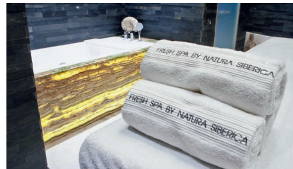
fresh spa by natura siberica

Одно из самых необычных заведений в Москве выдержано в сибирском антураже: с чучелом белого медведя, снегоступами на стенах, тяжелыми деревянными купелями, а также с травяным чаем, отварами ягод и трав, маслом кедровых орехов и молоком тувинского яка. Все эти диковинки собраны в спа-центре, где можно попариться в традициях народов Алтая, Хакасии, Бурятии и Тывы, с особой техникой банного парения и массажа. В спа-ритуалах используются целебные глины и грязи соленых озер — что именно выбрать, подскажут банщики.