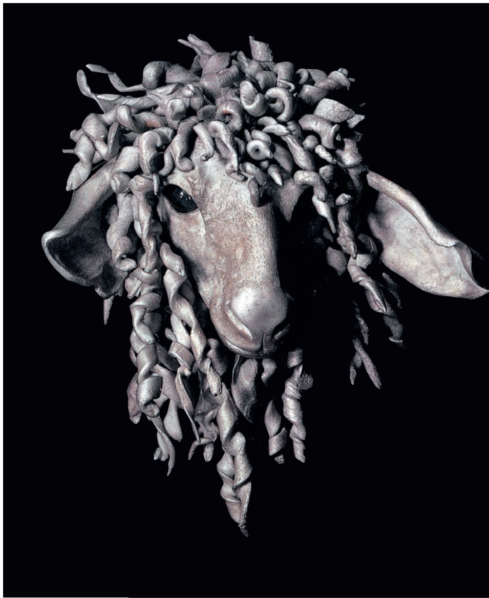
JOSEF PARI/JAR, PARIS