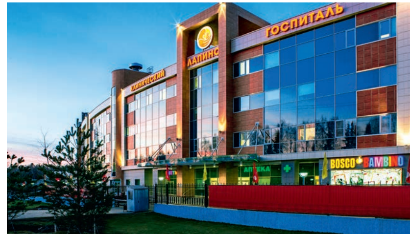
Клинический госпиталь «Лапино»