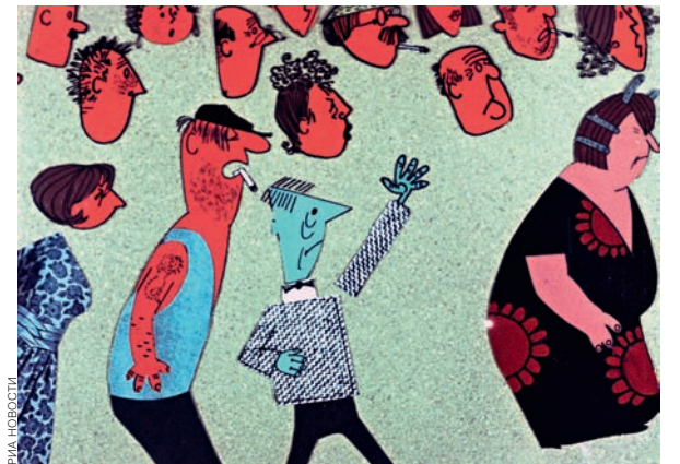
«История одного преступления». Режиссер Федор Хитрук. 1962