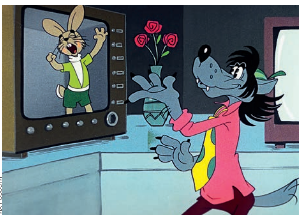
«Ну, погоди!». Режиссер Вячеслав Котеночкин. 1972