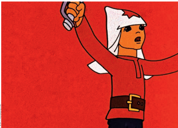
«Сказка о Мальчише-Кибальчише». Режиссер Александра Снежко-Блоцкая. 1958