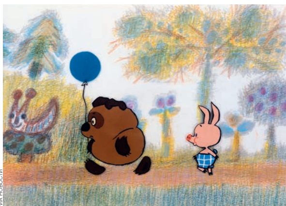
«Винни-Пух». Режиссер Федор Хитрук. 1969