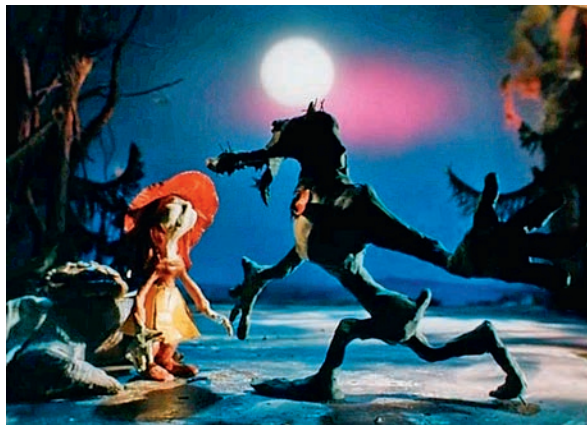
«Серый волк энд Красная Шапочка». Режиссер Гарри Бардин. 1990