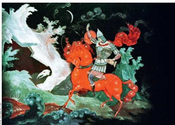
«Добрыня Никитич». Режиссер Владимир Дегтярев. 1965