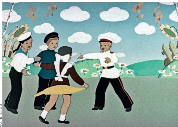
«Друзья-товарищи». Режиссер Виктор Громов. 1951