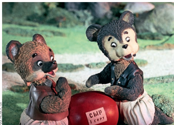
«Два жадных медвежонка». Режиссер Владимир Дегтярев. 1954