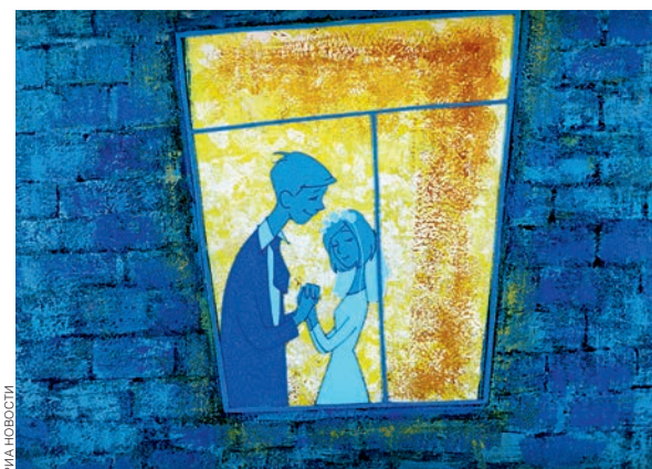
«Окно». Режиссер Борис Степанцев. 1966