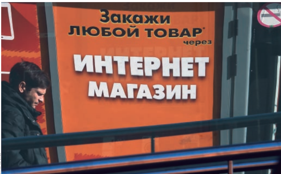
Основной вызов для регионального бизнеса — глобальность интернета

«Если смотреть на интернет-торговлю с точки зрения тех, кто сначала творец, а уже во вторую очередь ИП или ООО: дизайнеров мебе-