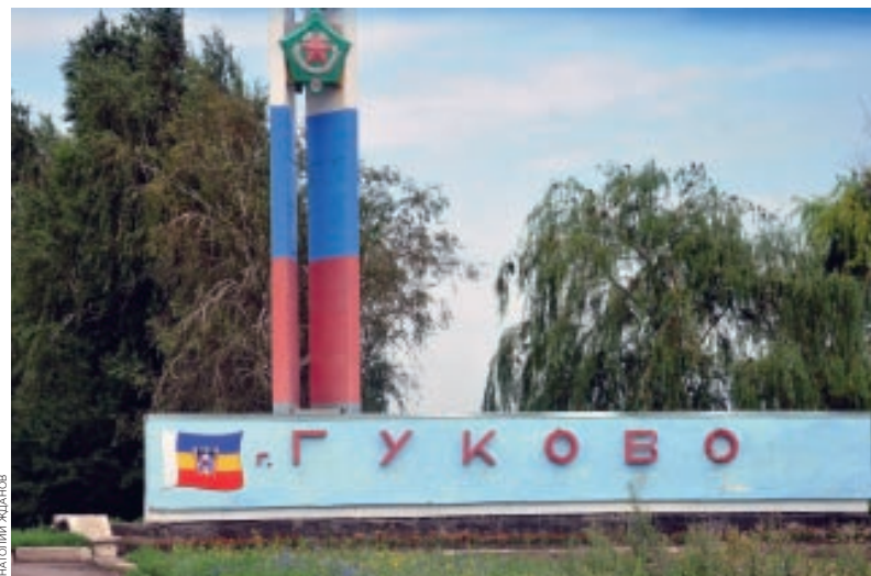
На юге России в список территорий опережающего развития внесен город Гуково Ростовской области

Эксперты считают, что южные регионы в ближайшее время вполне способны нарастить объемы инвестиций. «Краснодарский край, Ростовская область, Ставропольский край характеризуются диверсифицированной экономикой, благоприятными климатическими условиями, об-