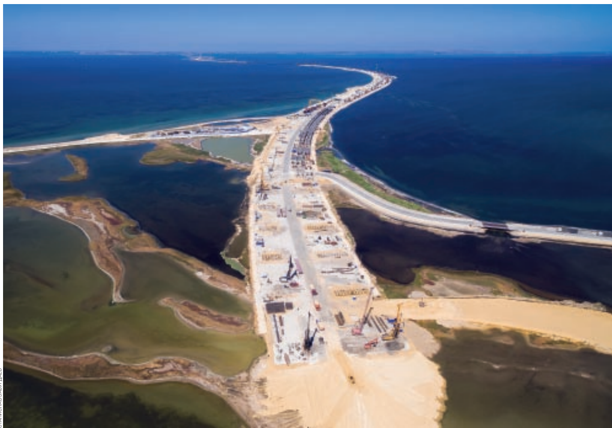
Еще один фактор, повышающий инвестиционную привлекательность Юга, — реализация в его регионах крупных проектов федерального значения, например, строительство Керченского моста