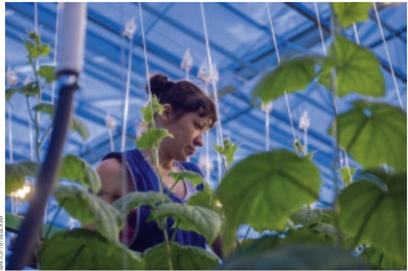
От продовольственного эмбарго больше всего выиграли производители овощей и фруктов

Эксперты сходятся во мнении, что сегменты российского пищевого сектора, где введено продовольственное эм-