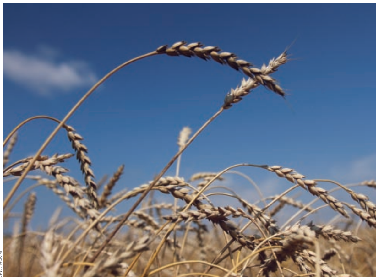
За год в сельском хозяйстве РФ число проектов с долей иностранного капитала подскочило на 30%