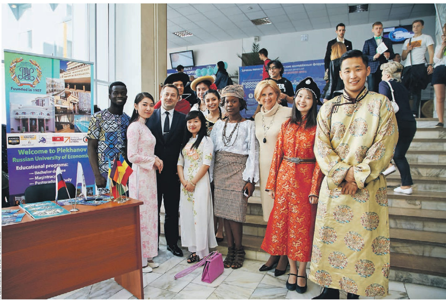
Лучшие университеты постоянно обмениваются студентами