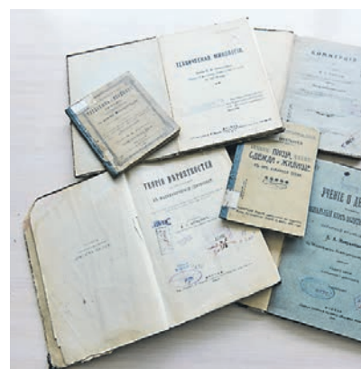
Наукой в университете начали заниматься еще до революции

Претендуя на ведущие позиции в российских и международных рейтингах, университет параллельно с образовательной деятельностью развивает научно-исследовательский центр, в состав которого входят пять научно-исследовательских институтов, три научно-образовательных центра, двадцать три лаборатории, семь научных школ и студенческий центр экономических исследований. Более 40 сотрудников университета являются постоянными экспертами министерств и ведомств, в том числе Совета Федерации, Госдумы, РАН, Банка России, Торгово-промышленной палаты, Евразийской экономической комиссии и ЮНЕСКО.