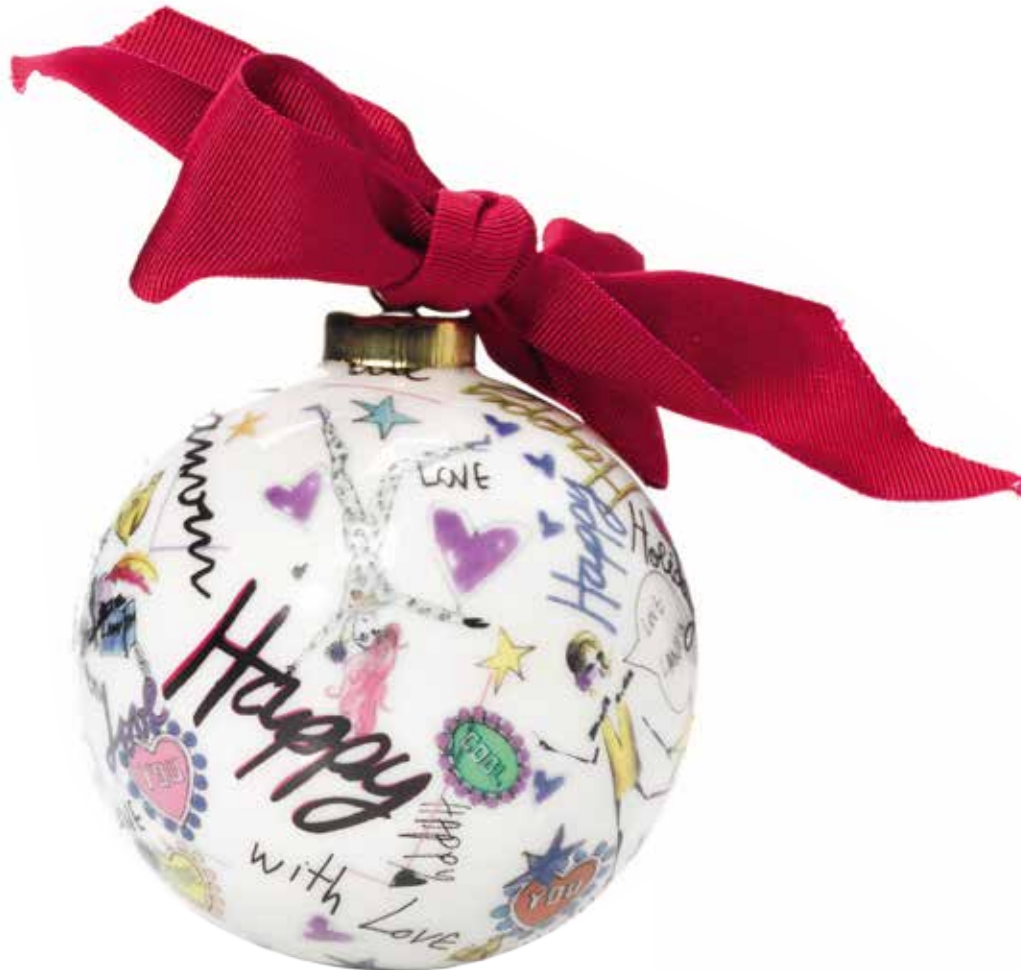
— Lanvin, елочное украшение