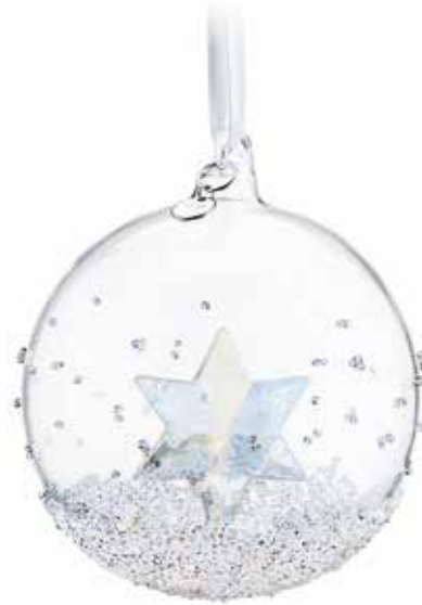
— Swarovski, елочное украшение