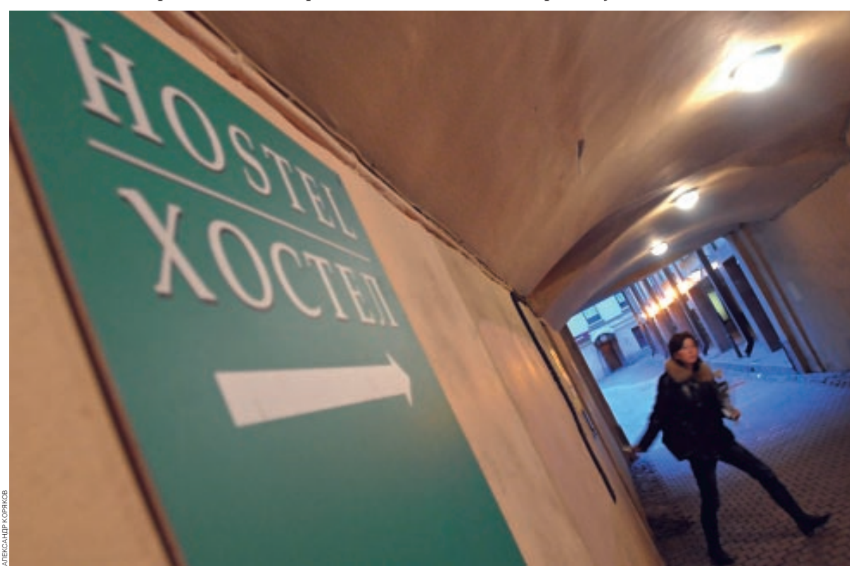
Из-за снижения доходов населения и падения курса национальной валюты активнее всего растут бюджетные туристические направления, и для развития этого сегмента необходимы гостиницы экономичного класса и хостелы