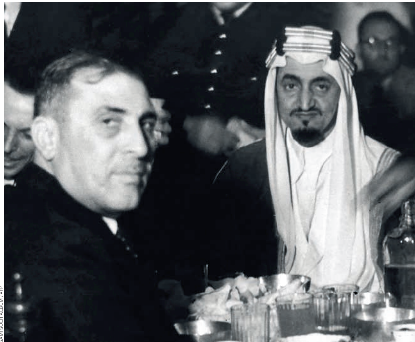
— США рассматривали режим военной диктатуры Адиба Шишекли (справа) как инструмент своей политики на Ближнем Востоке

Началом вооруженной борьбы «братьев» против режима Асада считается 1976 год; к концу десятилетия противостояние исламистов и режима достигло необычайной остроты. Например, в июне 1979 году жертвами атаки на курсантов Высшей артиллерийской академии в Алеппо стали 32 человека, десятки были ранены; большинство из раненых и убитых — алавиты, к которым относится и правящая в Сирии семья Асадов.