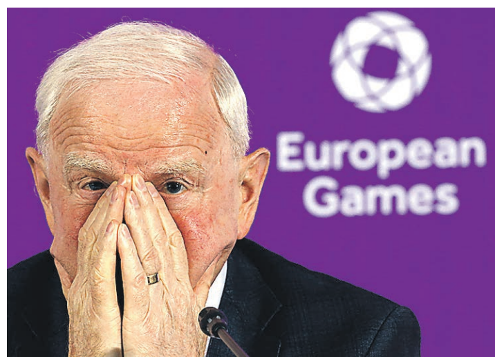
Члена исполкома Международного олимпийского комитета Патрика Хикки подозревают в причастности к незаконной перепродаже билетов

Международный олимпийский комитет может быть вовлечен в набирающий обороты громкий скандал, вызванный причастностью его руководителей к спекуляции билетами на олимпийские соревнования. В среду бразильские СМИ сообщили, что полиция арестовала видного функционера МОК Патрика Хикки. 71-летний ирландец помимо того, что является членом исполкома МОК, возглавляет также Европейский олимпийский комитет (ЕОК) и руководит Национальным олимпийским комитетом (НОК) Ирландии. Господину Хикки вменяется в вину причастность к незаконной перепродаже би-