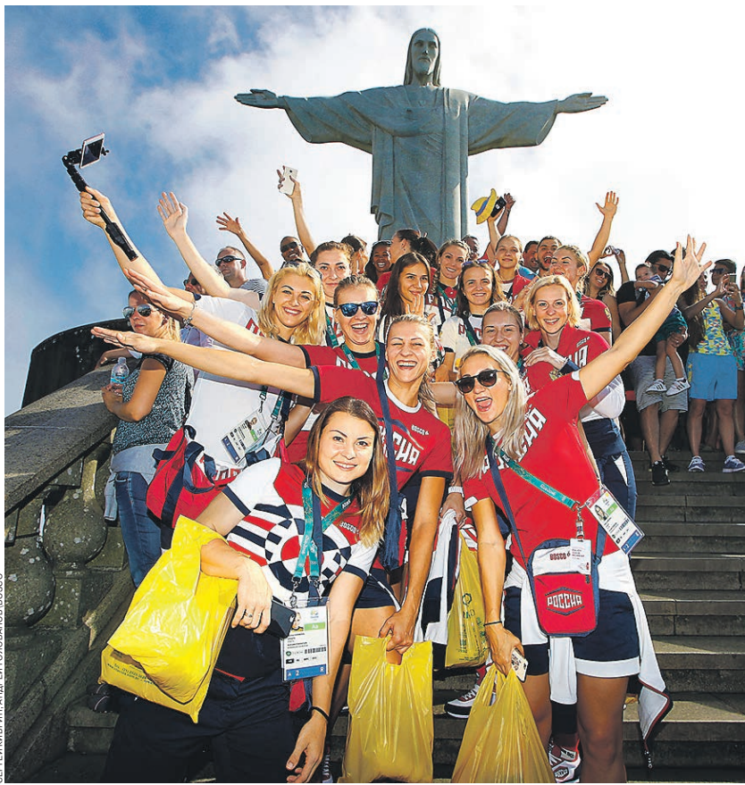
В центре Рио можно встретить не только туристов и волонтеров. Попадают и местные жители, и даже спортсмены (на фото — сборная России по гандболу)

района, а также привезенная художнику туристами со всего мира. Чилиец окончательно обесмертил свое имя, встретив смерть на ступенях собственного творения в 2013 году.