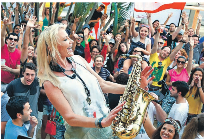
Блондинка-саксофонистка и разливное пиво — главные достопримечательности Австрийского олимпийского дома

Корреспондент «Коммерсантъ-bosco sport» в Рио АЛЕКСАНДР ЗИЛЬБЕРТ исследовал национальные дома Австрии, Германии, Дании, Катара, России и Швейцарии в Рио. Гости пытаются удивить бразильцев пластмассовым катком, арабским каллиграфическим почерком и устройством для зарядки телефонов с педальным приводом.