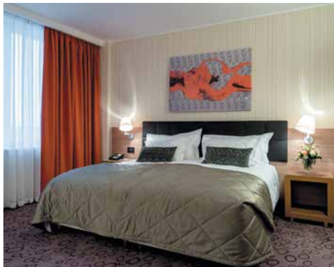
ИНТЕРЬЕР ПОЛУЛЮКСА В «ОСЕННИХ» ТОНАХ