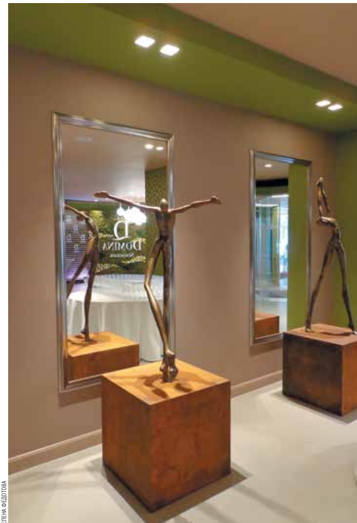
ДЕТАЛИ ИНТЕРЬЕРА В ХОЛЛЕ ОТЕЛЯ