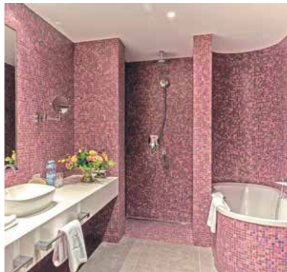
МОЗАИЧНЫЙ САМУЗЕЛ В ДВУХКОМНАТНОМ НОМЕРЕ КАТЕГОРИИ ЛЮКС