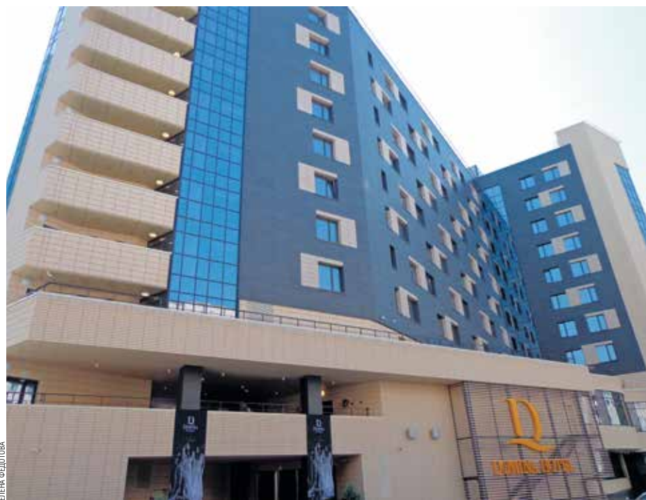
СОЧЕТАНИЕ РАЗНЫХ ПЛОСКОСТЕЙ ПРИДАЕТ ДИНАМИЧНОСТЬ ОБЛИКУ ЗДАНИЯ

Что касается бизнес-возможностей отеля, то здесь есть переговорная комната на 20 человек, четыре отдельных зала по 90 кв. м каждый, которые могут быть трансформированы в два отдельных зала вместимостью до 240 человек. Все эти возможности являются абсолютной новинкой в индустрии гостеприимства Новосибирска — третьего по численности населения города в России. ■