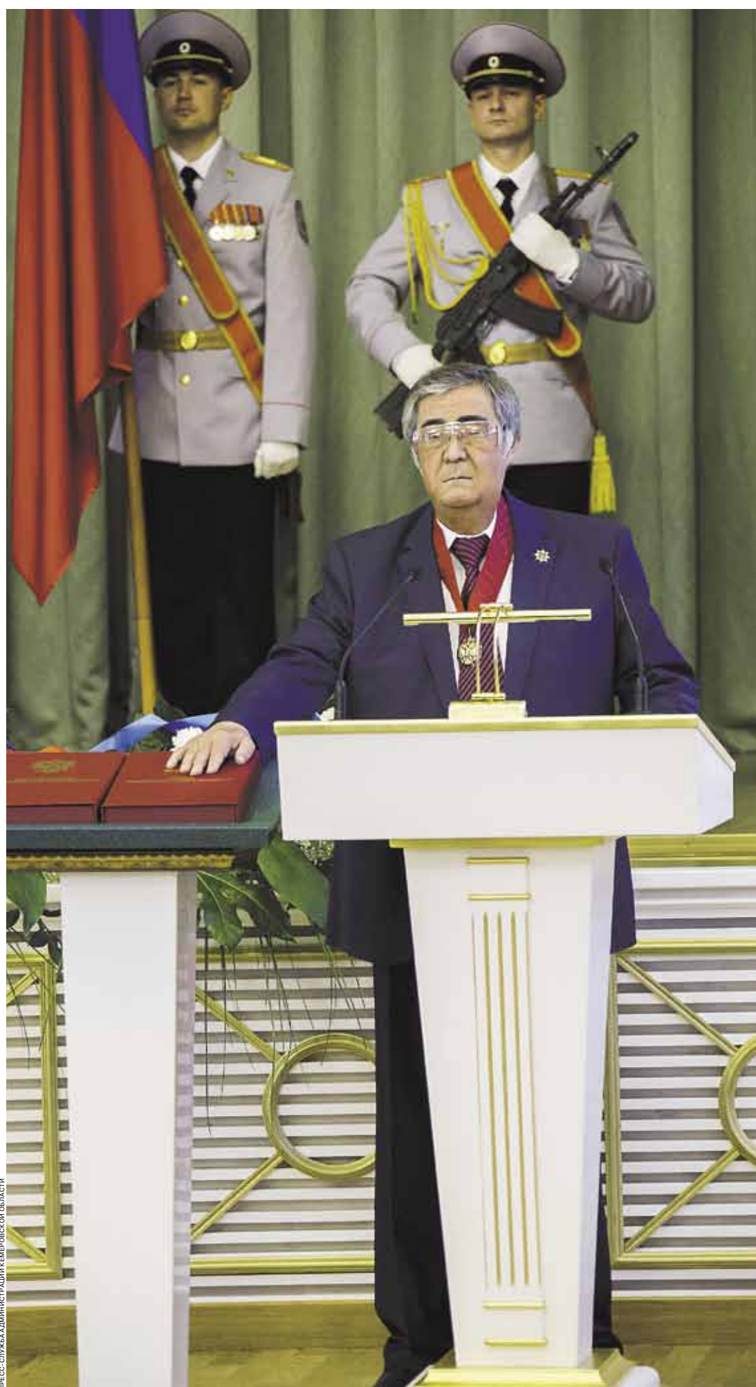
В сентябре Аман Тулеев снова был избран губернатором Кемеровской области. На этот раз он набрал 96,69% голосов. Регион Тулеев руководит с 1997 года. Новый срок полномочий истекает в 2020-м