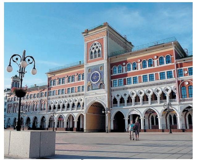
Центральная площадь г. Йошкар-Ола (Республика Марий Эл)

Перспективным для компании остается запуск новой производственной линии фасадных и стеновых полнообъемных панелей из керамического кирпича. Сам производственный корпус площадью девять тыс. кв м уже построен на территории предприятия. В рамках программы модернизации в настоящее время ведутся переговоры с мировыми брендами промышленного машиностроения.