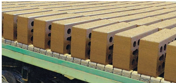
Производственные мощности завода в 2015 г. вышли на отметку 75 млн шт. кирпича в год

Модернизация нижегородского производства позволяет продукции «Кермы» успешно конкурировать с голландскими, немецкими, бельгийскими