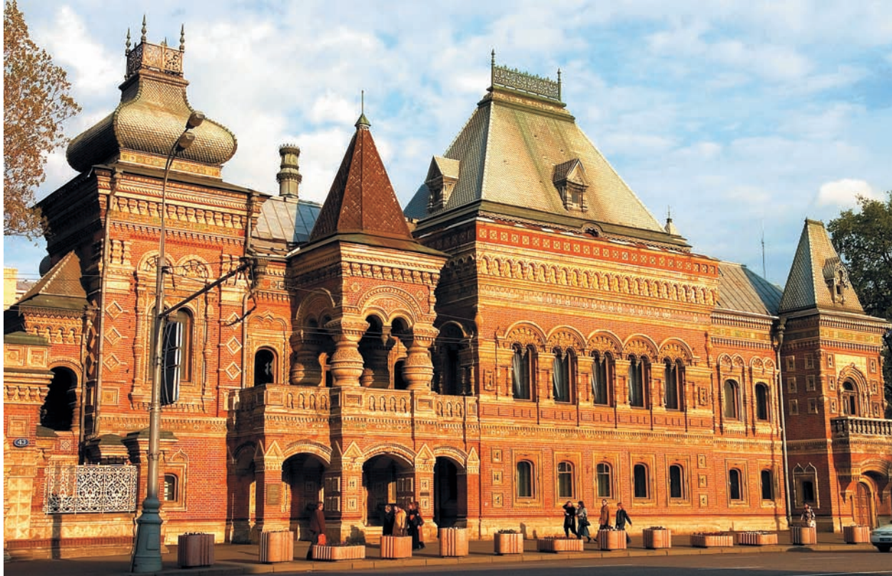
Французское посольство (г. Москва)

ОАО «Керма» на рынке фасадного керамического кирпича России уже 27 лет, однако в прошлом году у предприятия началась новая история. В кризисный 2015 год компания реализует масштабную инвестиционную программу, наращивает объемы производства и готовится к выпуску нового продукта.