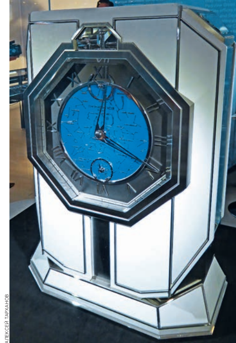
Лот 28. Thomas Mercer Britannica Only Watch 2015. €72–100,8 тыс.