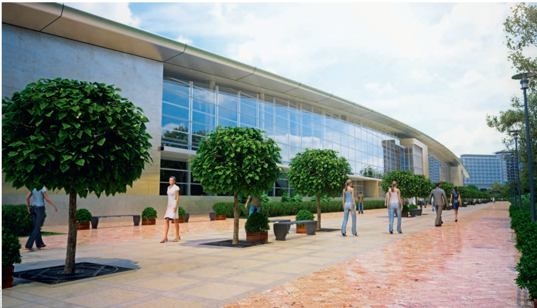
«ВТБ АРЕНА ПАРК»