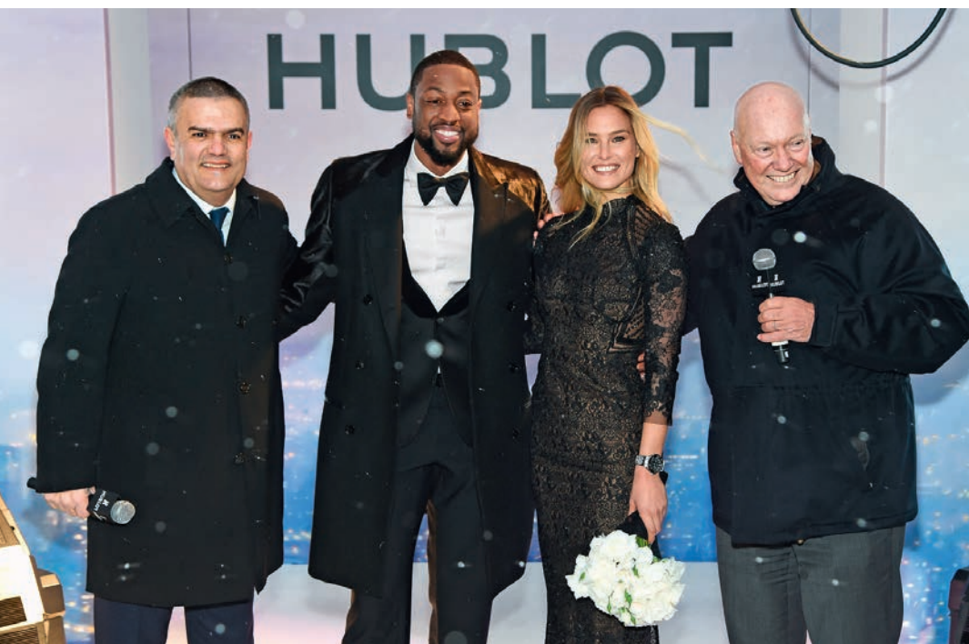
Рикардо Гваделупе, Дуэйн Уэйд, Бар Рафаэли, Жан-Клод Бивер

14 ФЕВРАЛЯ текущего года в Нью-Йорке состоялась мировая премьера новых часов Hublot Big Bang Broderie, которые до этого могла видеть только профессиональная пресса. Также у мануфактуры впервые появилась женщина-посол. Успешная модель, телеведущая и бизнесвумен Бар Рафаэли блистала в новых часах и черном кружевном платье под сотней вспышек фотографов на пороге готовящегося к открытию нового бутика Hublot на Мэдисон-авеню, пока холодный нью-йоркский ветер пытался разрушить ее идеальную укладку. Интересно, что ее платье было произведено на той же мануфактуре, что изготавливает кружево для новых часов. Это кружево благодаря изобретенной инженерами Hublot технологии теперь стало возможным внедрять в материал корпуса самих часов. Но лучше о них рассказывает главный идеолог, ангел-хранитель бренда, а также вот уже несколько лет президент часового подразделения концерна LVMH неутомимый Жан-Клод Бивер.