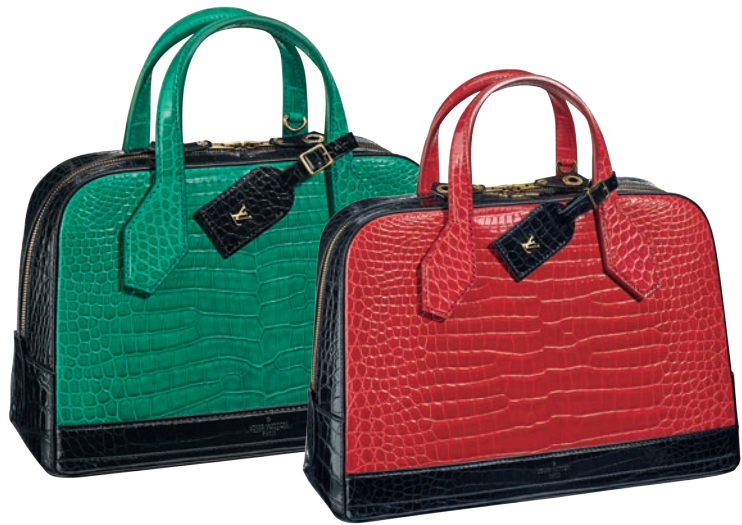
ИЗОБРЕТЕНИЕ ВСЕ НОВЫХ СУМОК — ОДНА ИЗ ЗАДАЧ, С КОТОРЫМИ УСПЕШНО СПРАВЛЯЮТСЯ ДИЗАЙНЕРЫ АКСЕССУАРОВ ПОД ПРЕВОДИТЕЛЬСТВОМ НИКОЛЯ ЖЕСЬЕРА