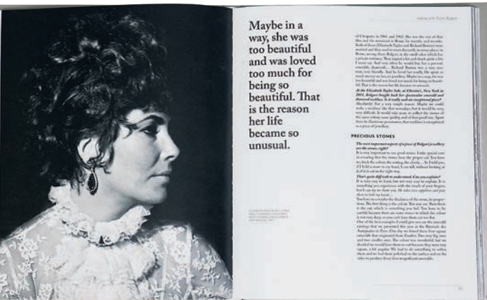
ОБЛОЖКА И СТРАНИЦЫ ИЗ КНИГИ «ROMA PASSION JEWELS»