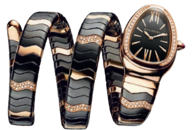
ЧАСЫ SERPENTI SPIGA, 2014