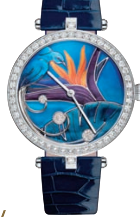
— Van Cleef & Arpels, Complication Poetic Oiseau Paradis, 2015